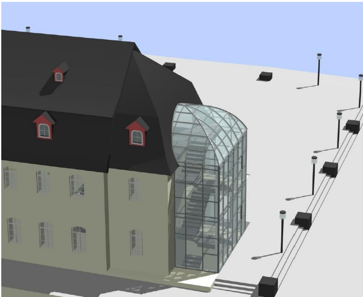
Gestaltungsvorschlag Ing.Büro Bahlo, Stand 12.5.2015

Im Zuge des Aufstellungsbeschlusses zur 6. Änderung wurde am 12.5.2016 eine Ansicht unterbreitet, die nunmehr Grundlage für eine behutsame Fortentwicklung, nach Möglichkeit im Einvernehmen mit der Denkmalpflege, sein soll.