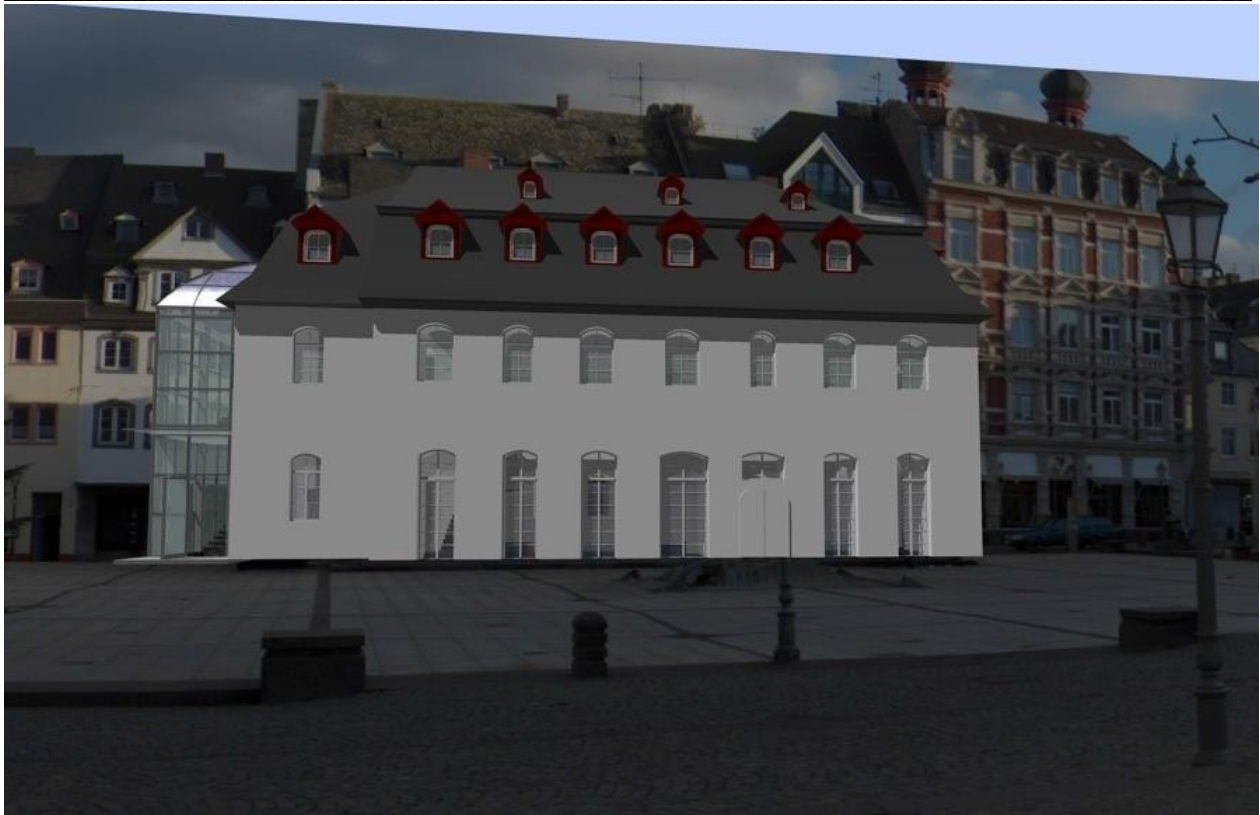
Gestaltungsvorschlag Ing.Büro Bahlo, Stand 12.5.2015

Bis zur Sitzung des Fachbereichsausschusses IV am 5.7.2016 soll noch aus den Erörterungen zwischen Stadt, Denkmalpflege, Bauherren und Hochbauingenieur eine modifizierte Ansicht vom Ing. Büro Bahlo erarbeitet werden, die bis zum Redaktionsschluss am 29.6.2016 allerdings noch nicht vorgelegen hat. Sie wird spätestens im FBA IV 5.7.2016 als Tischvorlage präsentiert. Ggf. resultieren hieraus noch Änderungen in den Textfestsetzungen und in der Begründung; diese würden dann im Fachbereichsausschuss von der Verwaltung vor dem Entwurfs- und Offenlagebeschluss mündlich erläutert.