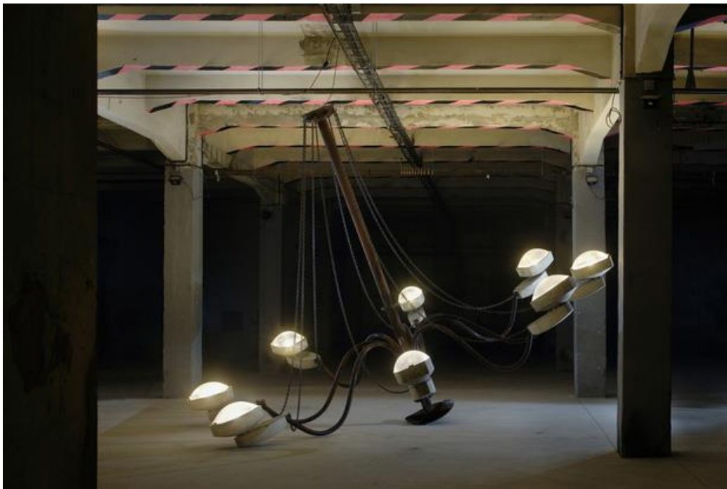
Křištof Kintera: My light is your light , 2008, Stahlkonstruktion, Lampe, Elektroinstallation, 420 cm, Ø 560 cm

Der 1973 in Prag geborene Křištof Kintera gilt als einer der erfolgreichsten und interessantesten unter den jungen Künstler der Tschechischen Republik. Er erschafft surrealistisch anmutende Skulpturen und Installationen in denen er alltägliche Objekte auf unerwarteten Arten und Weisen kombiniert, verfremdet oder ironisiert. In dem Maße, wie er Alltagsobjekte in Bezug auf ihre Größe verändert und inszeniert bzw. in neuen Kontexten zeigt, erhalten diese, und damit auch die Räume ihrer Präsentation eine neue Bedeutungszuschreibung.