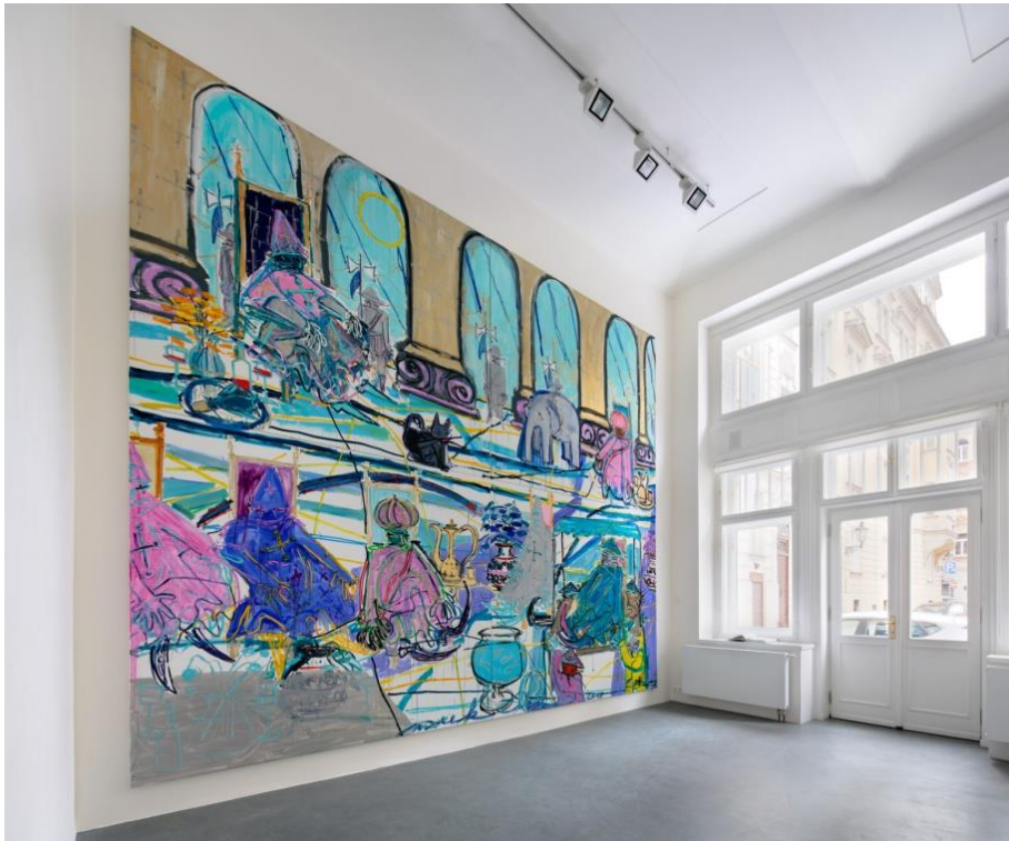
Marek Číhal: Urbane Gesellschaft , 2013, Öl auf Leinwand, 300 x 500 cm, Prag

Der jüngste Künstler der Gruppe, Marek Číhal (geb. 1983 in Prag) bemalt und strukturiert riesige Wände mit allegorischen oder abstrakten Darstellungen. Seine Malereien, Fresken und Zeichnungen interagieren mit der Architektur der Räume, für die sie geschaffen worden sind. Sie erschaffen eine mysteriöse Atmosphäre und sind Interpretationen der gelebten Realität von Menschen, die der Künstler studiert und gekannt hat und deren „geistiges“ Porträt an eben diesen urbanen Orten sie wieder geben sollen. Marek Číhal ist seiner eigenen Aussage nach, klassisch und zeitgenössisch zugleich. Seine monumentalen Darstellungen evozieren die Dekorationsweise früherer Paläste und Kirchenräume, jedoch mit den Mitteln eines Künstlers, der im schnelllebigen, autonomen Zeitalter des 21. Jahrhunderts lebt.