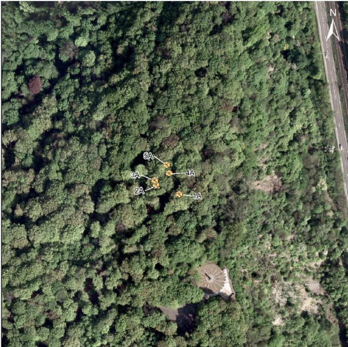
Abbildung 2: Lageübersicht der zu sichernden Altbäume