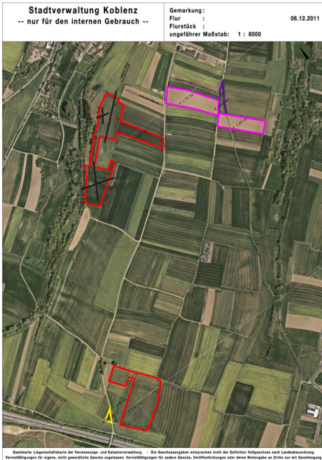
Bild 2: Lageplan der externen CEF-Maßnahmen gemäß Nr. D Hinweise „Artenschutz“