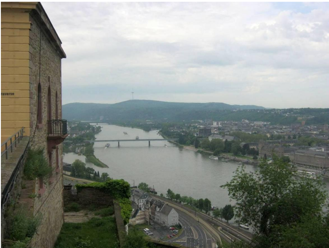
Abbildung 2: Blick von der Festung Ehrenbreitstein auf den Stadtwald