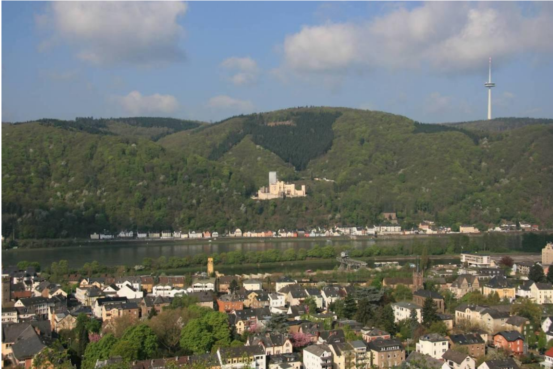
Abbildung 1: Blick von der Burg Lahneck auf den Stadtwald und Schloss Stolzenfels