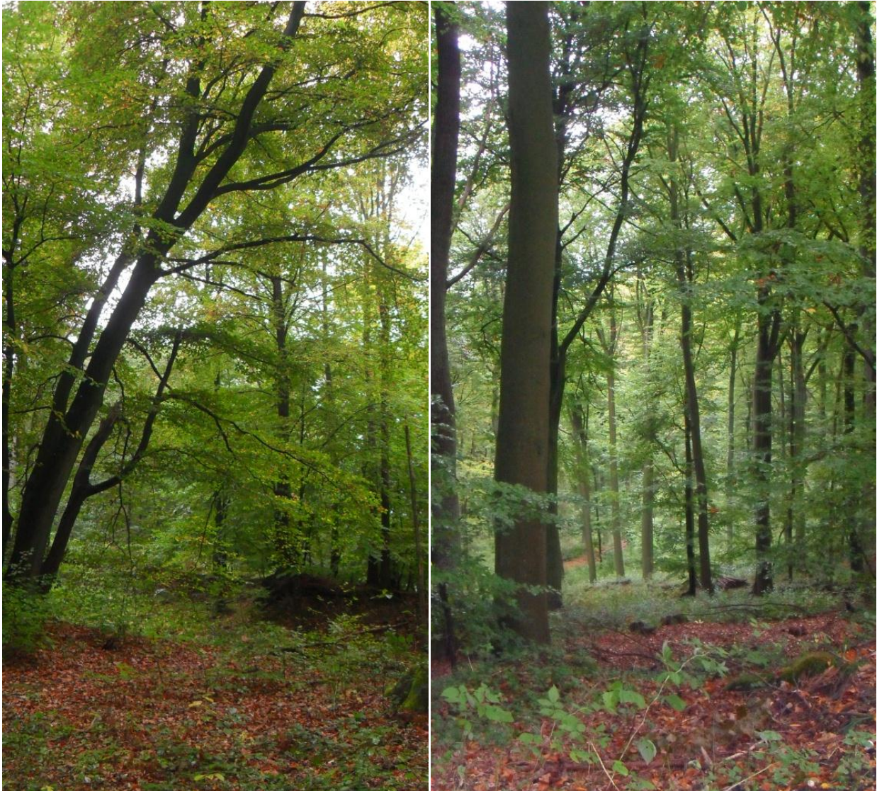
Abbildung 8: Waldbestände in der Potenzialfläche westlich der B 49