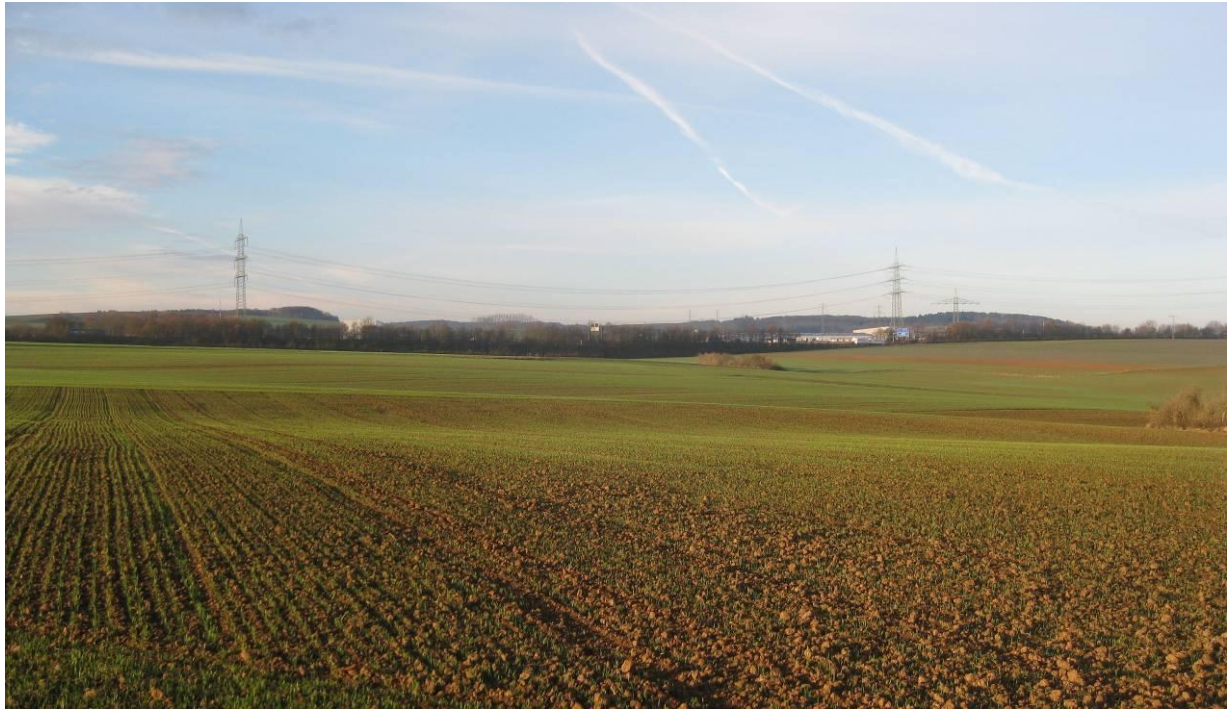
Abbildung 5: Blick von Südosten auf die Fläche Rübenach

Nach Erfahrungswerten der Landesforsten 23 benötigt eine WEA aktueller Bauart im Durchschnitt 15 – 20 Hektar Fläche. Das bedeutet, dass hier bei idealem Zuschnitt der Fläche maximal drei bis vier Anlagen errichtet werden könnten.