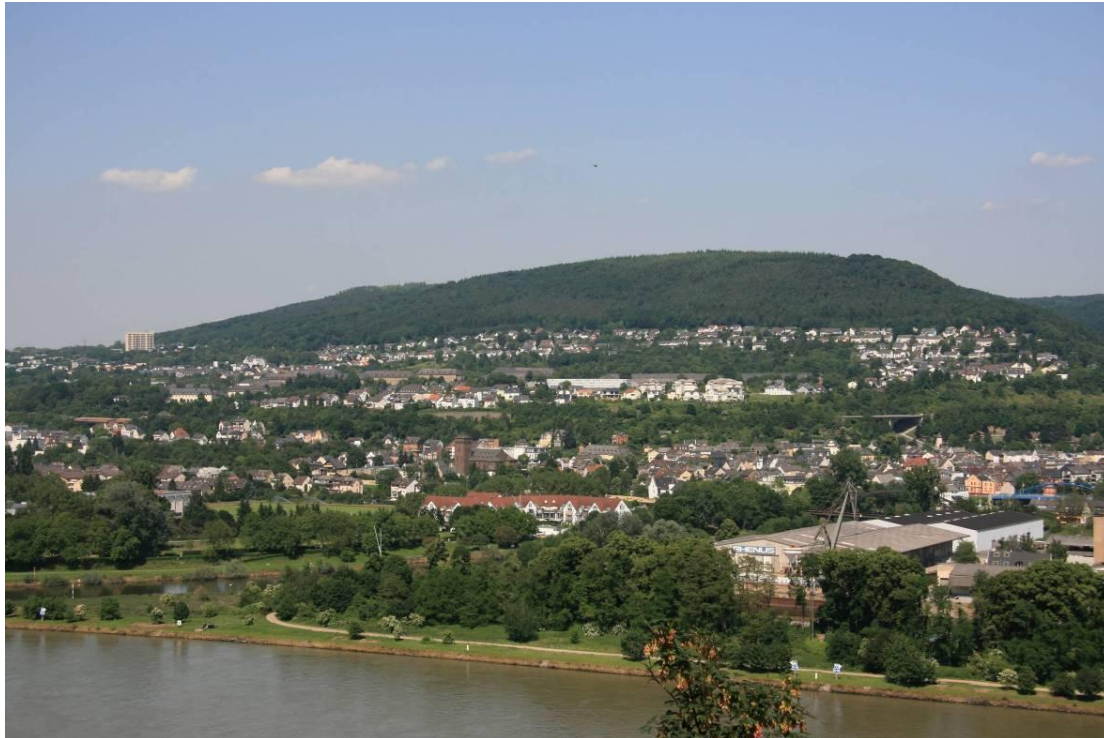
Abbildung 4: Blick von Schloss Stolzenfels auf den Horchheimer Wald