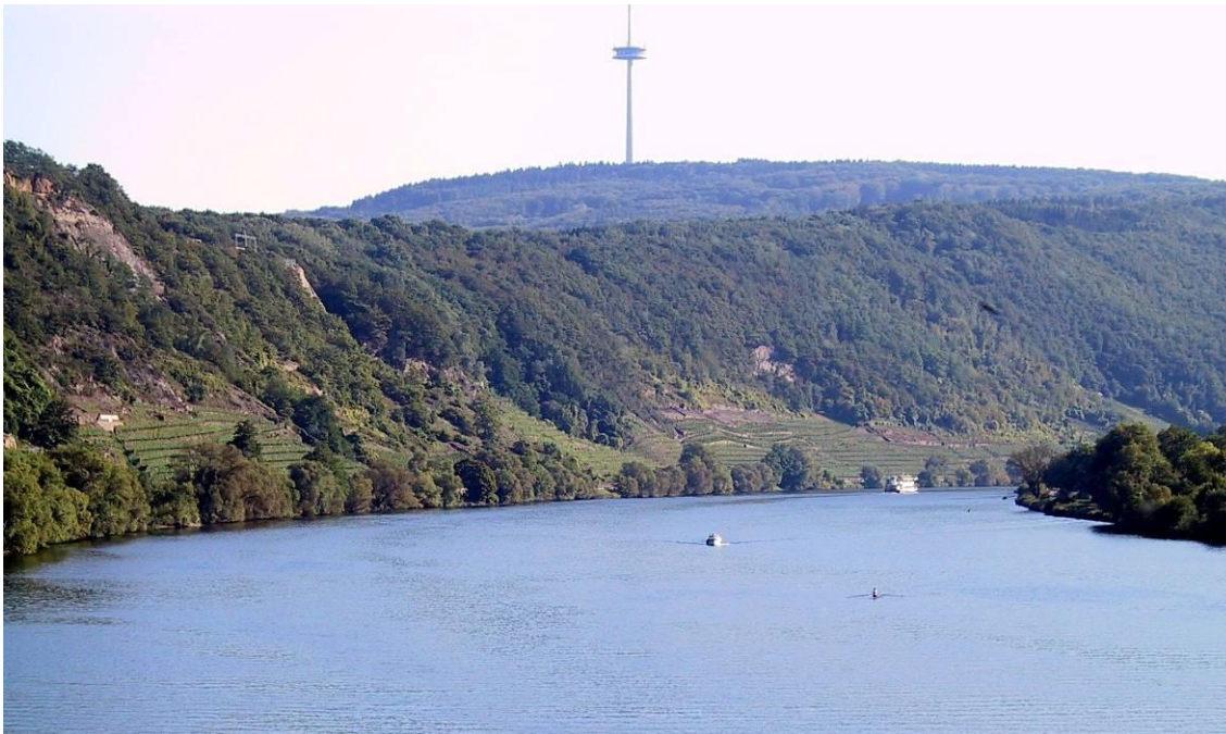
Abbildung 3: Blick von der Gülser Bahnbrücke über die Mosel auf den Stadtwald