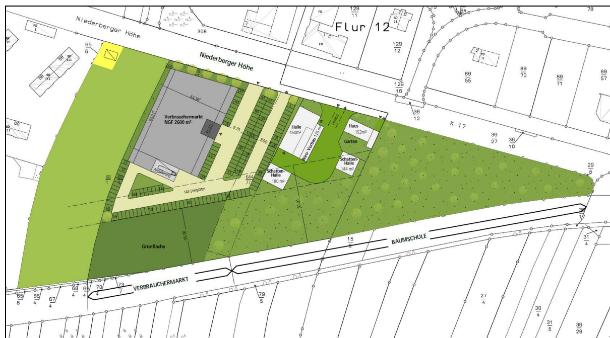
Abb. 2: Städtebauliches Konzept

Mit der vorgesehenen Gebäudeanordnung kann im Süden eine Freifläche zum Schutz der Klimafunktionen erhalten werden.