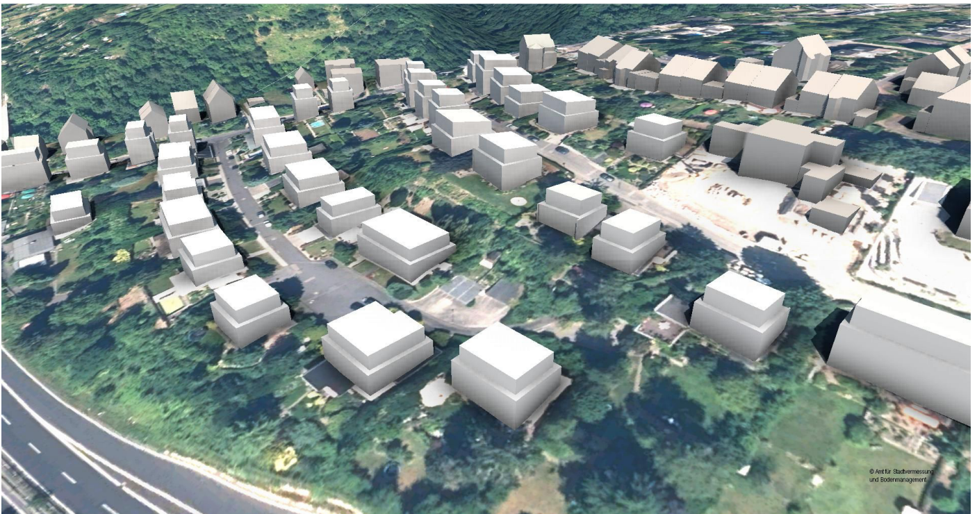
Blick von Süden (Darstellung vereinfacht)