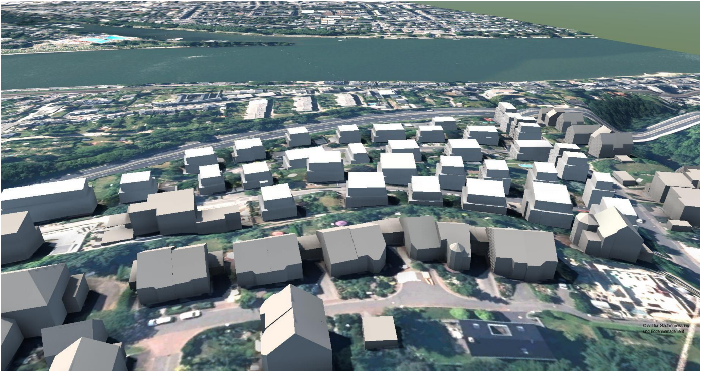
Blick von Osten (Darstellung vereinfacht)