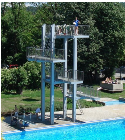
(Beispiel Fa. Roigk)