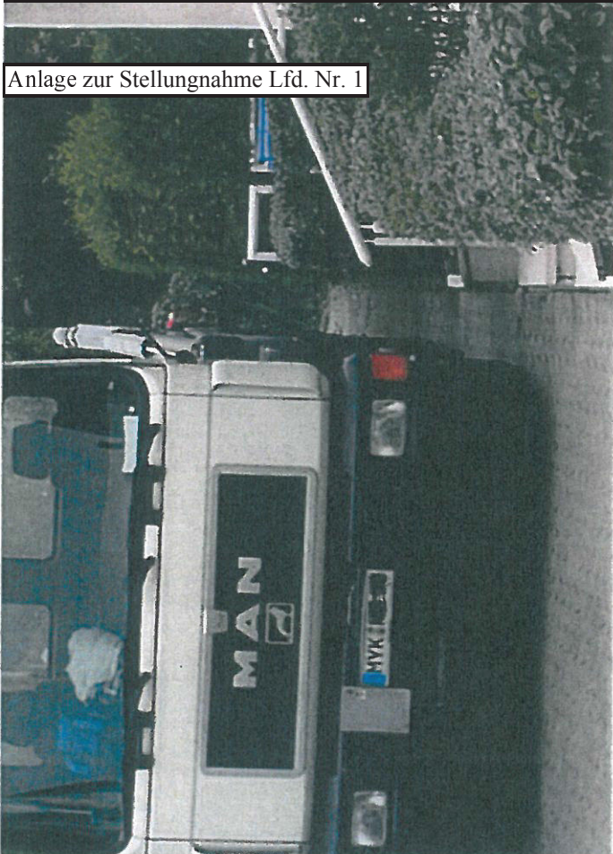
Anlage zur Stellungnahme Lfd. Nr. 1