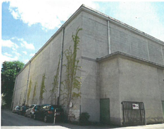
Nordwestseite des Hochbunkers Nagelsgasse in der Koblenzer Altstadt

Die Bunkeranlage des ehemaligen Bürgerhospitals wurde für den Schutz der Bevölkerung im 2. Weltkrieg errichtet und war seinerzeit für 1799 Personen, später für 2700 Personen ausgelegt. Nach dem Krieg diente die Anlage zuerst als Gefängnis. In den Jahren 1947-1950 wurde der Bunker an die Firma Kallfels vermietet, bevor er letztlich als Lagerraum für beschlagnahmte Möbel des Requisitionsamtes diente. Heute befinden sich in den einzelnen Schutzräumen noch die bunkertypischen Einrichtungsgegenstände, wie z.B. Etagenbetten, Sitzgelegenheiten etc. Im Erdgeschoss werden teilweise Schutzräume vom Amt 50 (Jugendamt) als Lagerfläche genutzt.