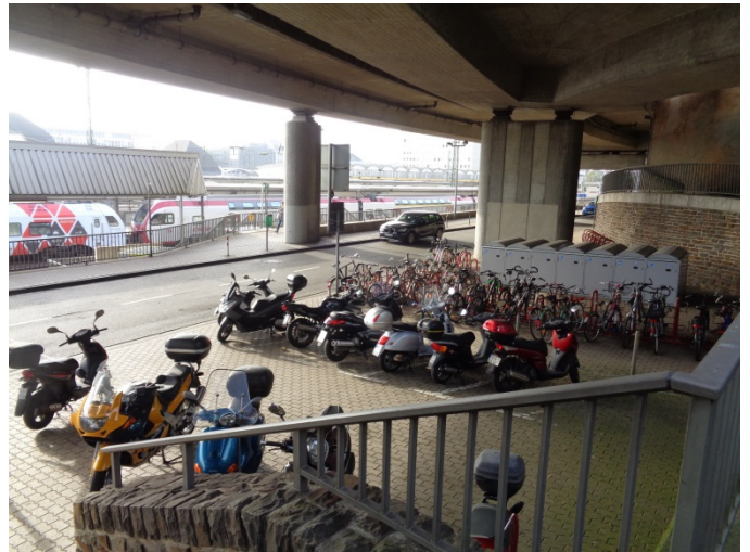
Bild 2: Motorrad-/ Fahrradabstellplätze und Fahrradboxen (Beschaffung 2014/ 15)