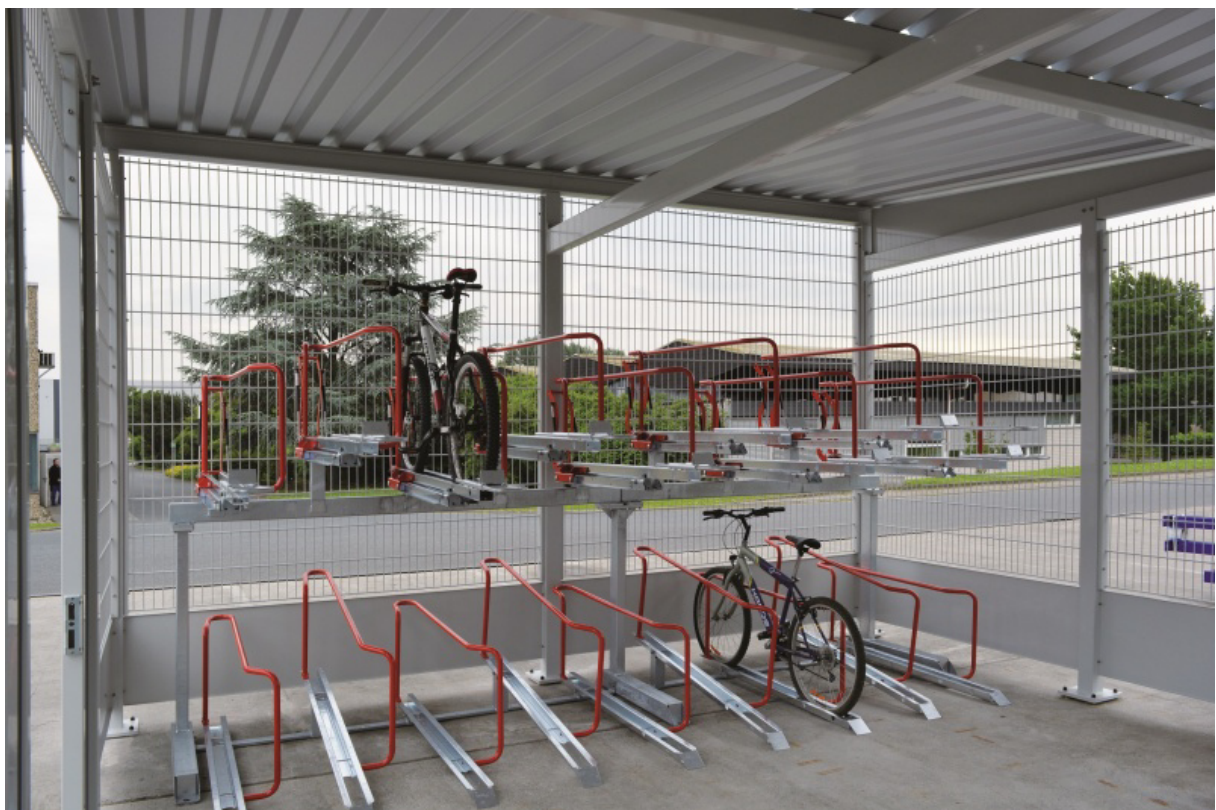
Bild 5: Fahrradsammelgarage mit Doppelstockparksystem - Herstellerbeispiel

Die Sammelgarage besteht aus einer Stahlkonstruktion (Stützen, Träger, Passbleche und Gitterzaunelemente, Dachtrapezbleche). Die Gründung erfolgt auf Betonfundamenten. Ein Doppelstocksystem sorgt für geordnetes Abstellen. Die 2. Abstellebene wird mit Hilfe einer Hebeltechnik (Gasdruckfeder) leicht zugänglich gemacht. Fahrräder lassen sich mit einem Schloss individuell am Einstellbügel sichern.