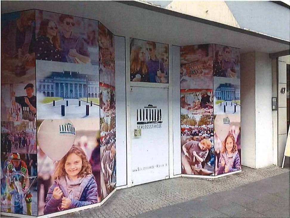
Schloßstraße 43 - 45