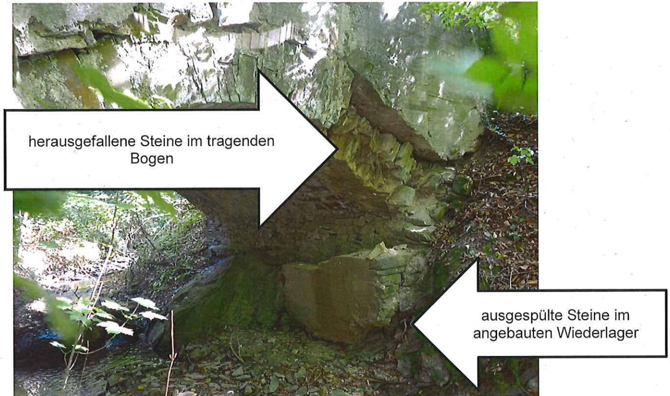
Bild 2 Bogen mit fehlenden Steinen im tragenden Bogen