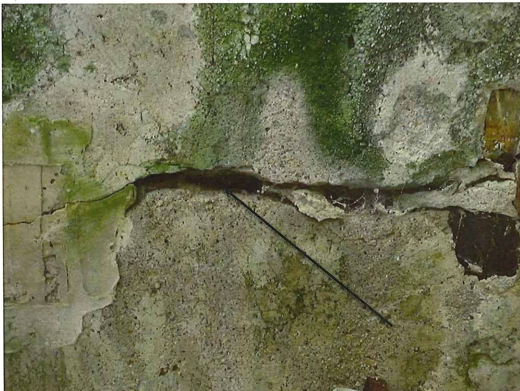
Bild 3 deutlicher Riss im Bogenscheitel in Bogenrichtung ca.1-1,5 cm