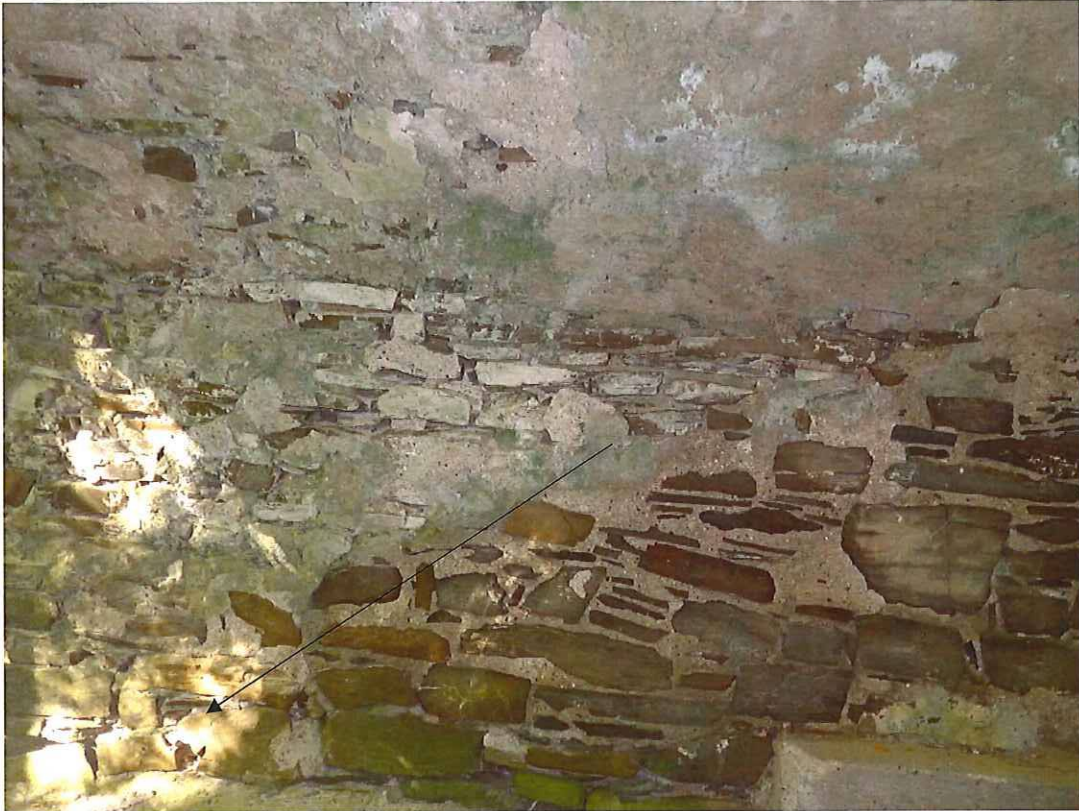
Bild 4 ausgespülte Vermörtelung