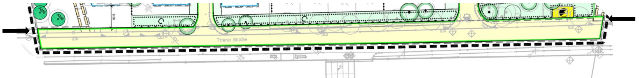
Abbildung 2 – Entwurf der Bebauungsplanzeichnung zur aktuell anstehenden erneuten Offenlage (Darstellung ohne Maßstab) mit dem angepassten Zuschnitt der öffentlichen Straßenverkehrsfläche aufgrund der Stellungnahme der Energienetze Mittelrhein