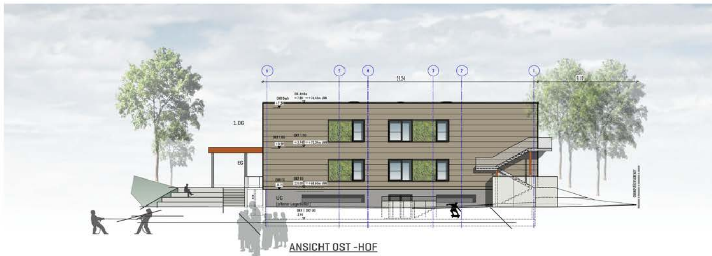
ANSICHT OST -HOF