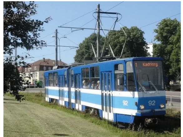
Beschleunigung des ÖPNV in Tallinn mit besonderem Bahnkörper für die Straßenbahn

kommt zu einer Verlagerung innerhalb des Umweltverbands und die angedachten positiven Effekte für den Klimaschutz fallen – entsprechend den örtlichen Gegebenheiten – kleiner aus als gedacht.