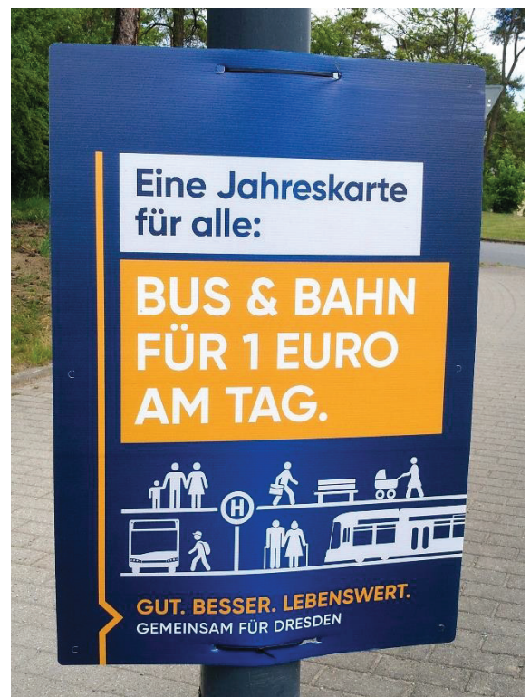
Das 365-Euro-Ticket ist Thema im Wahlkampf

Bevor Tarifsenkungen umgesetzt werden, müssen die öffentlichen Mittel im ersten Schritt vorrangig in Ausbau von Angebot, Kapazitäten und Qualität investiert werden. Hierfür gilt es, die derzeit vorhandenen finanziellen Spielräume in den Haushalten von Bund und Ländern zu nutzen und zusätzliche Mittel für Aus- und Neubau sowie die Grunderneuerung des ÖPNV zur Verfügung zu stellen.