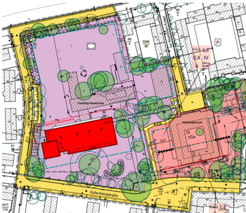
Auszug B-Plan Entwurf mit KITA Stand 12.01.2021