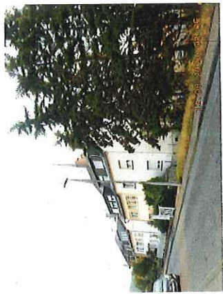
Straßenfront Pastor-Busenbender-Str. 17-19

Ausstellungs- (Druck)datum: 31.07.2020 vom Architekturbüro V&C