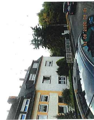
Straßenfront Pastor-Busenbender-Str. 17-19