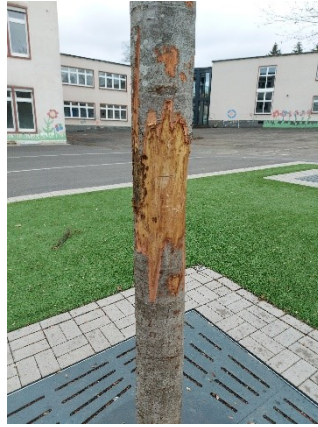
Beschädigter Baum Bild 1