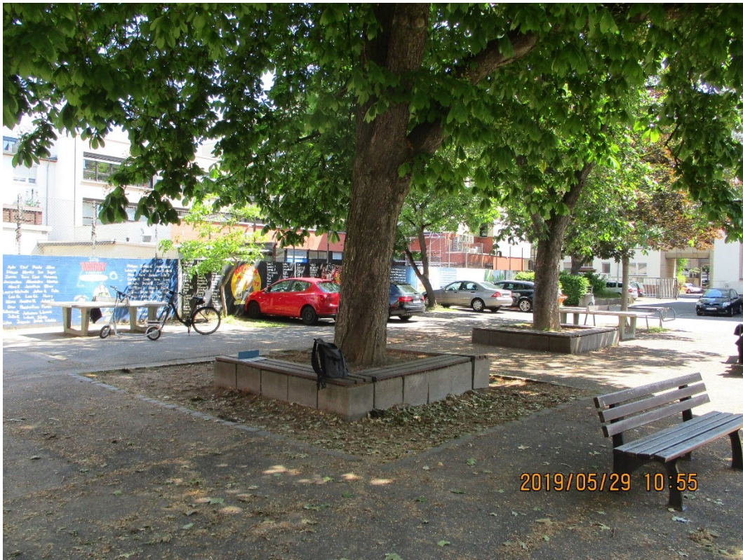
Abbildung 1: 1. BA vor Sanierung