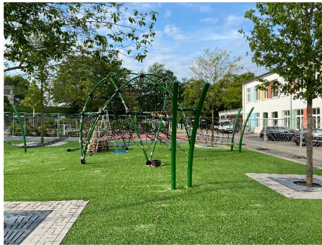
Multifunktionsspielgerät Bild 2