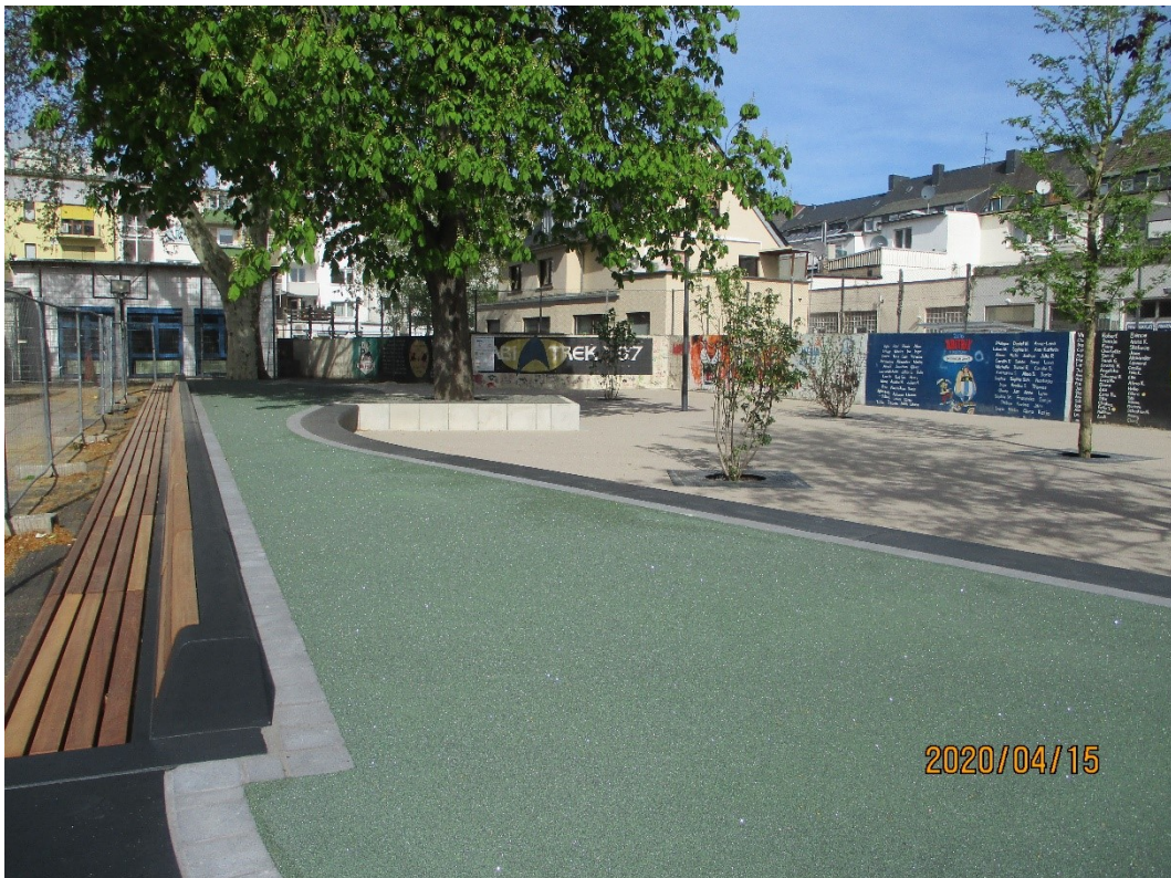
Abbildung 2: Nach Sanierung