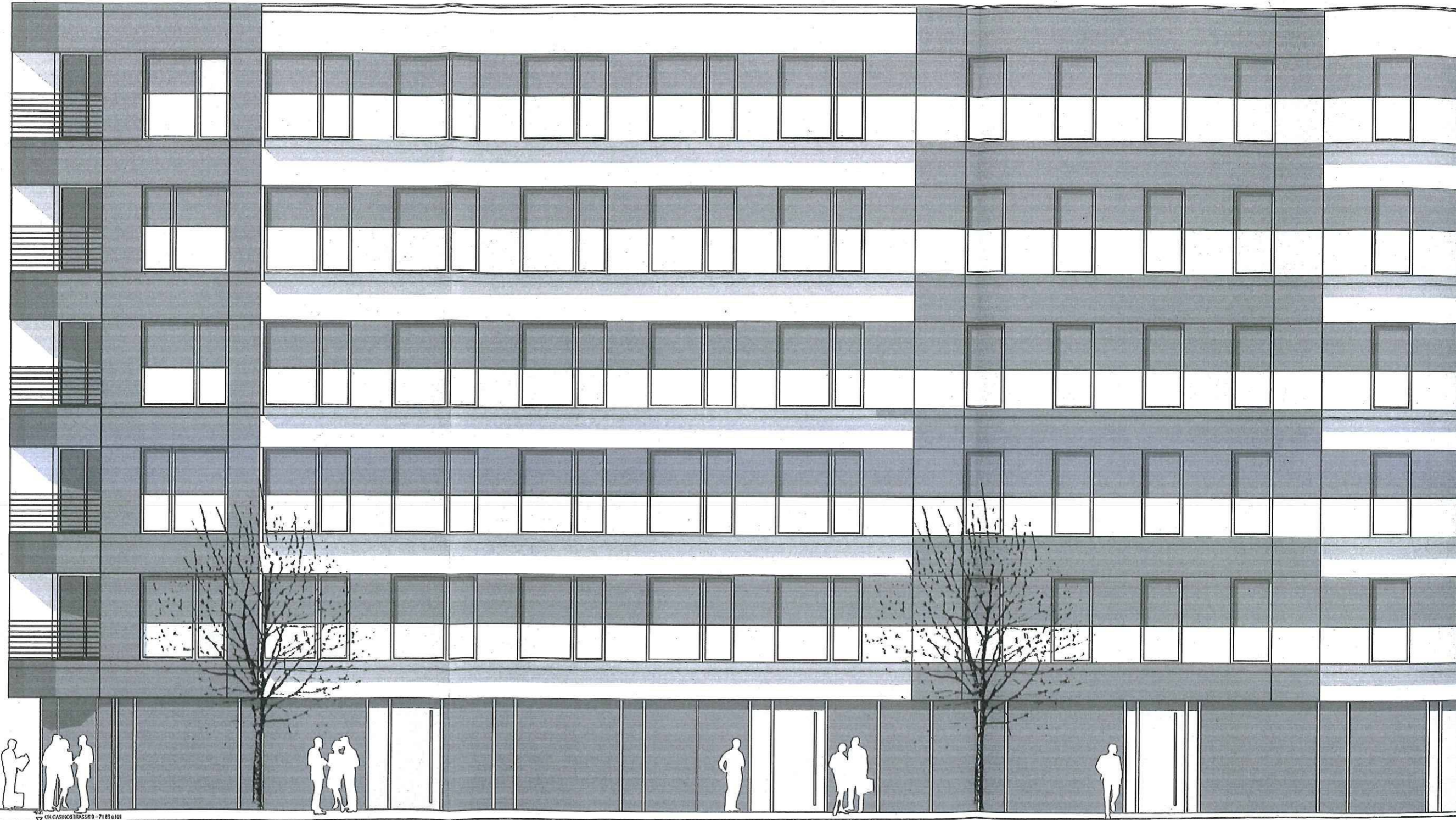
Ansicht Casinostraße Westen