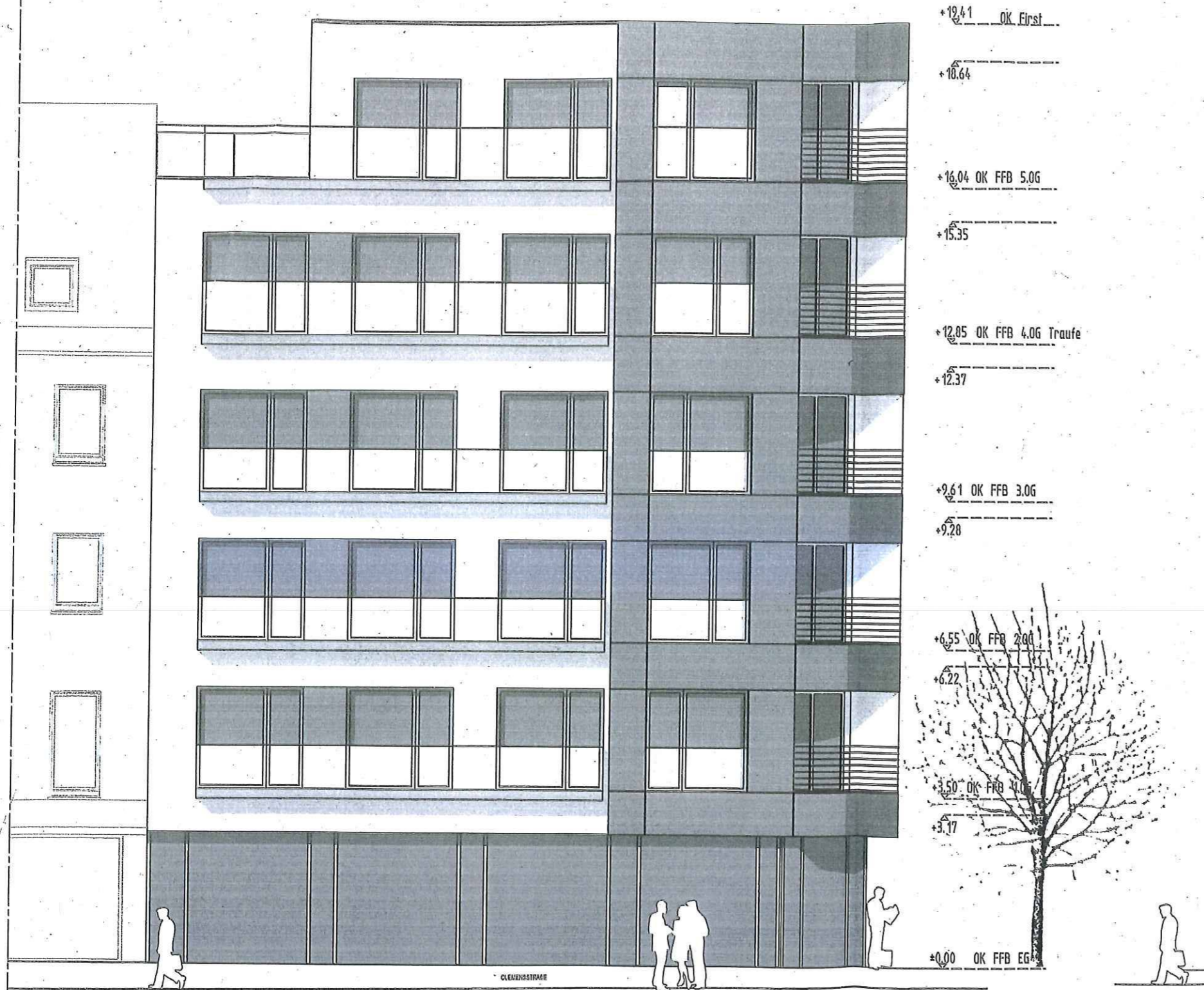
Ansicht Clemensstraße Norden