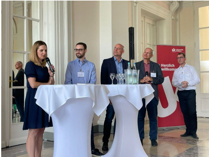
Abschlussveranstaltung im Schloss Koblenz