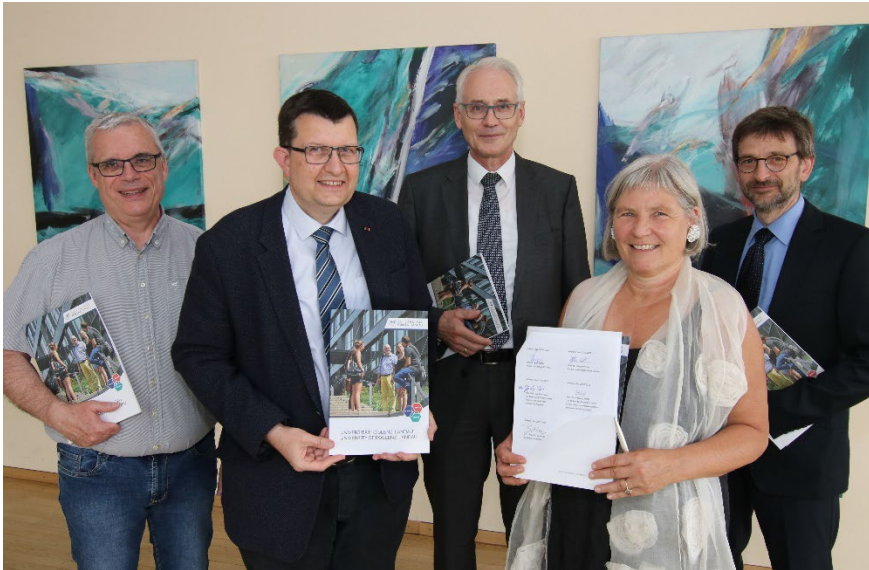
Vertragsunterzeichnung am 20. Juli 2022