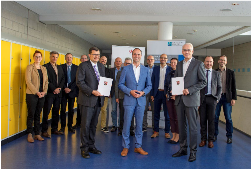
Übergabe Förderbescheid durch Minister Hoch