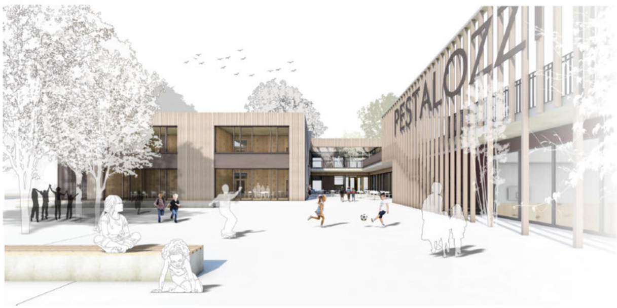
Perspektive Innenhof zum Haupteingang hin