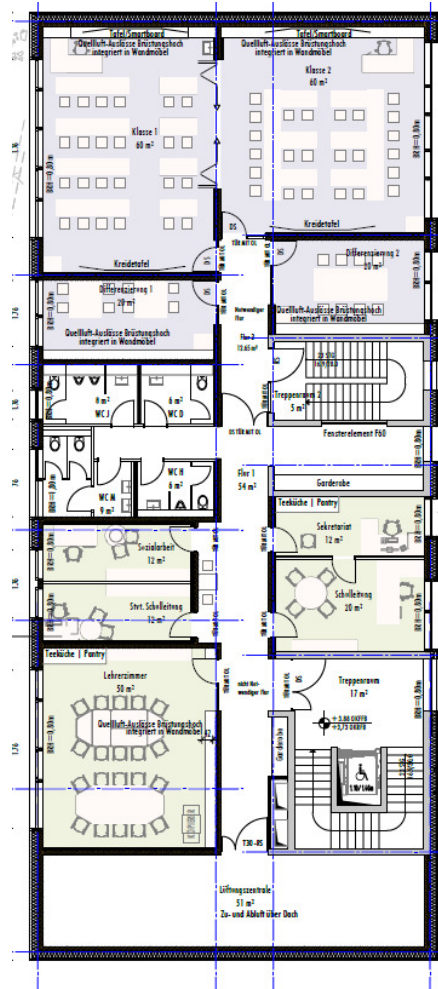
Abbildung 2: Grundriss OG