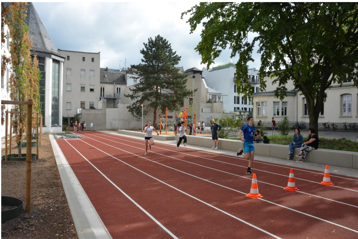
Abbildung 1 rege Nutzung der neuen Sport- Spiel- und Aufenthaltsflächen

Die Maßnahme ist abgeschlossen. Die Entwicklungspflege der Bepflanzung wird noch über zwei Jahre von der Landschaftsbaufirma fortgeführt.