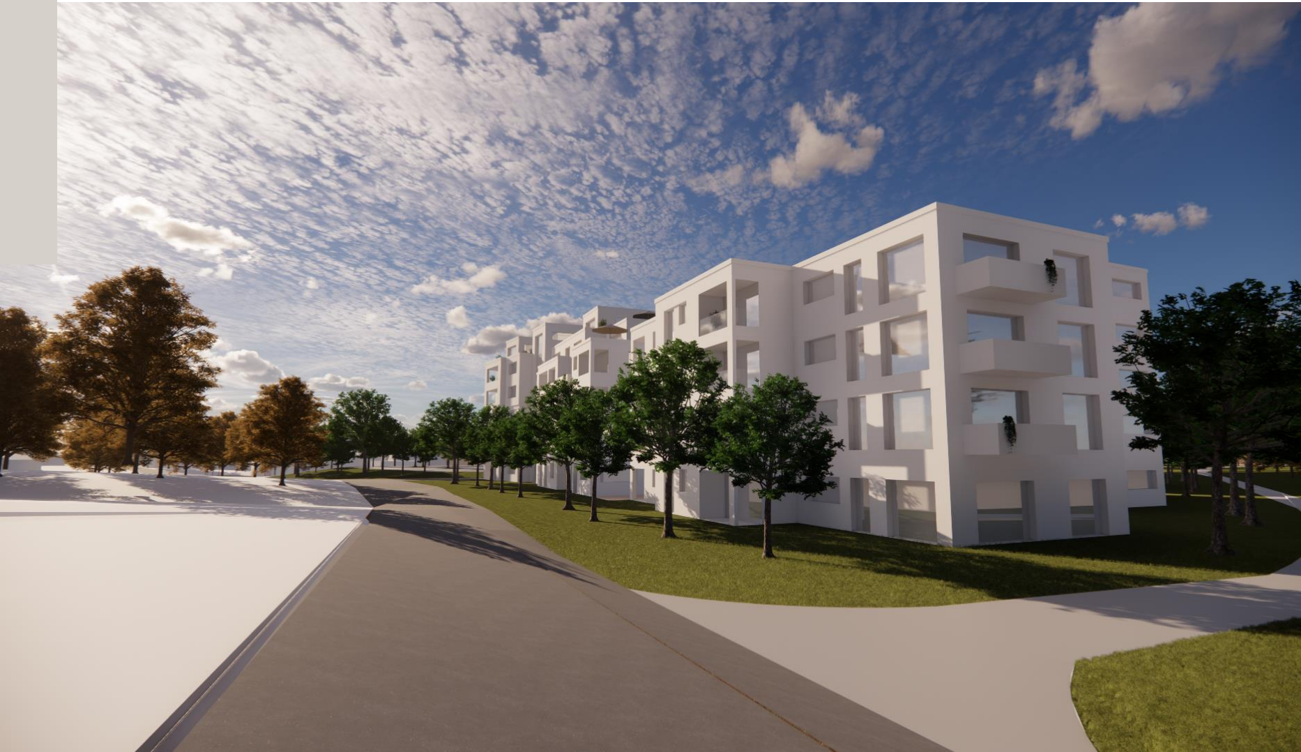
Entreegebäude Wohnen am Ortseingang