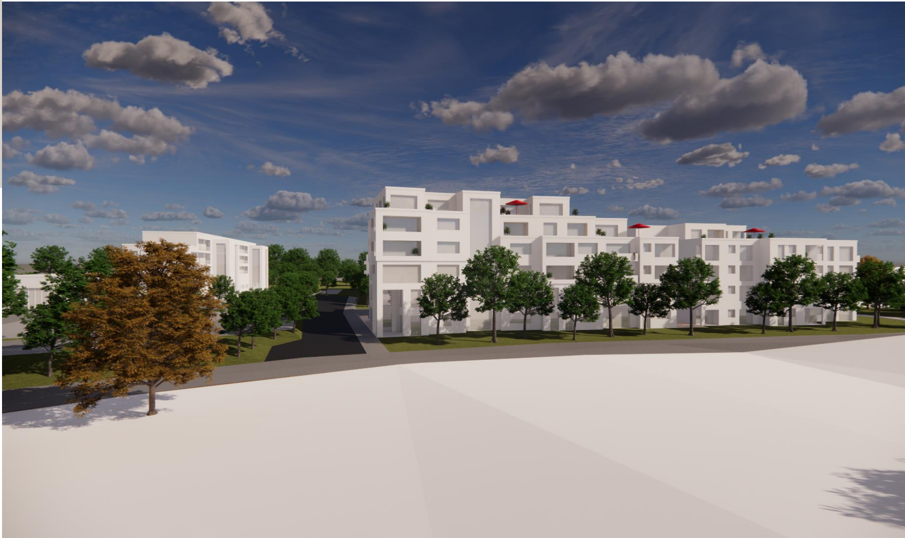
Rheingold-Quartier an der Aachener Straße