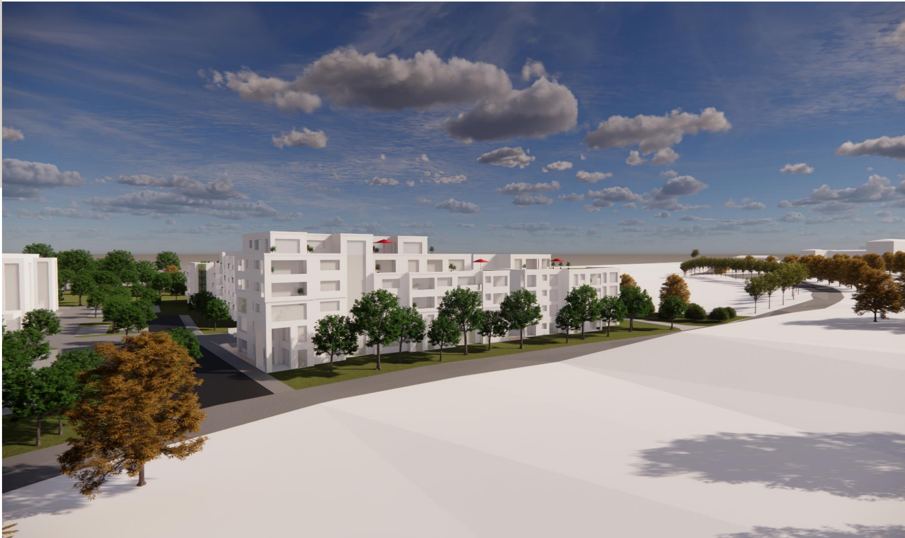
Rheingold-Quartier mit Blickrichtung BWZK