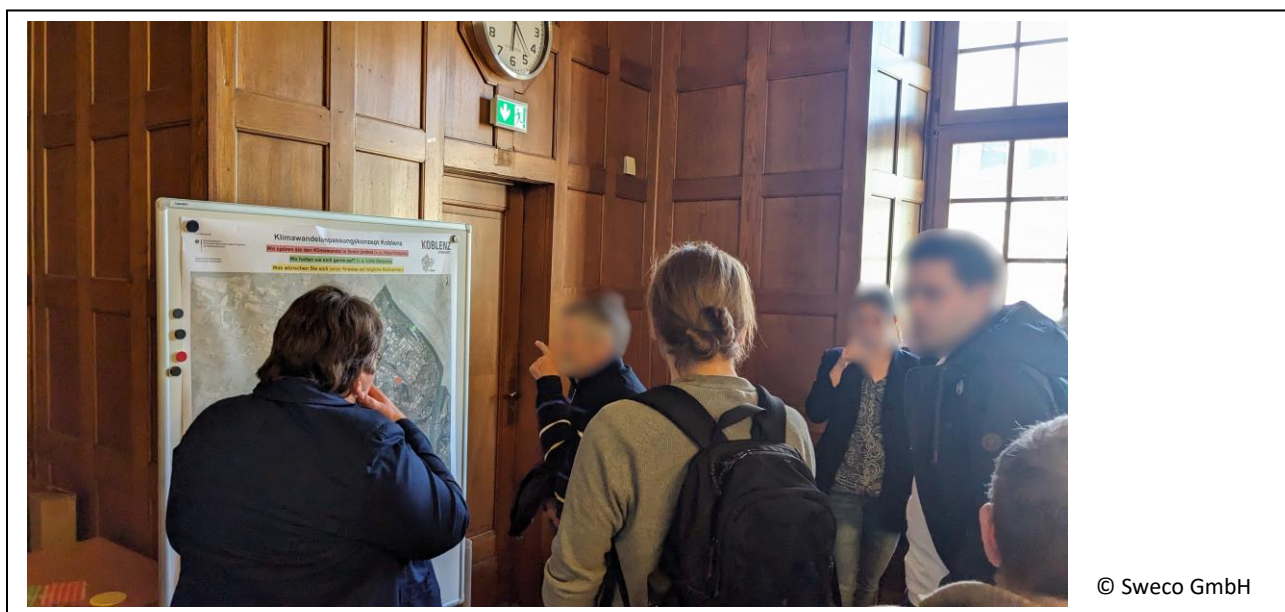
Abbildung 12: Diskussion an der Station 3