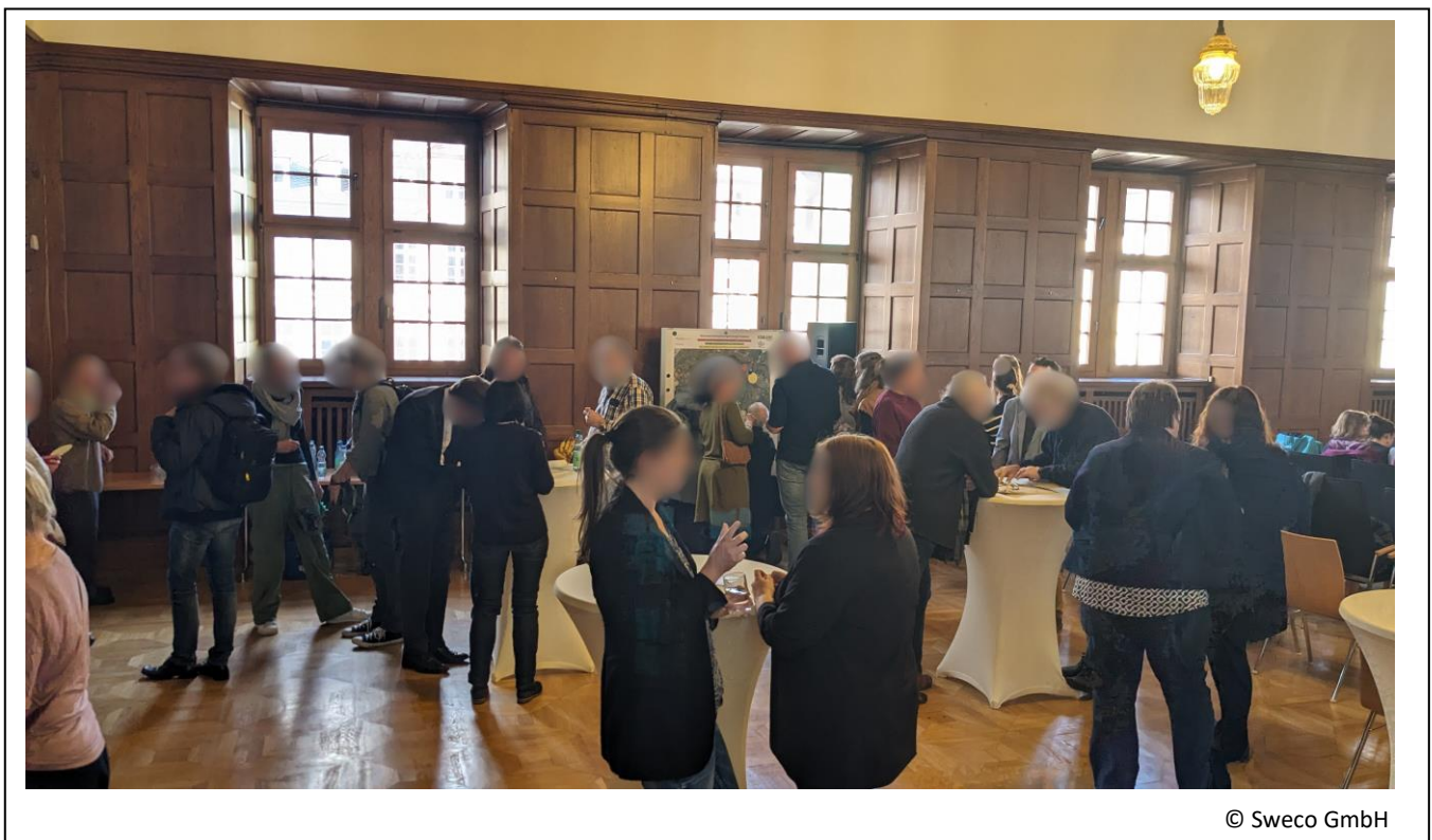
Abbildung 9: Austausch und Vernetzung I