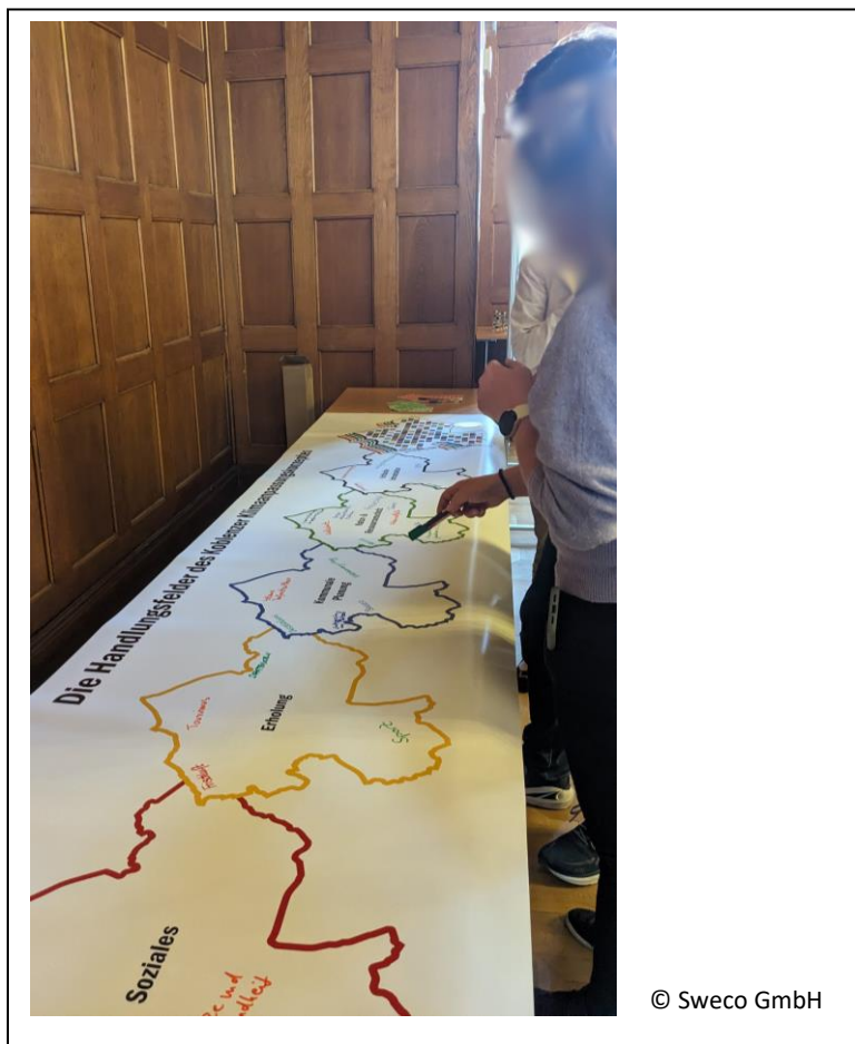
Abbildung 11: Bearbeitung der Station 1