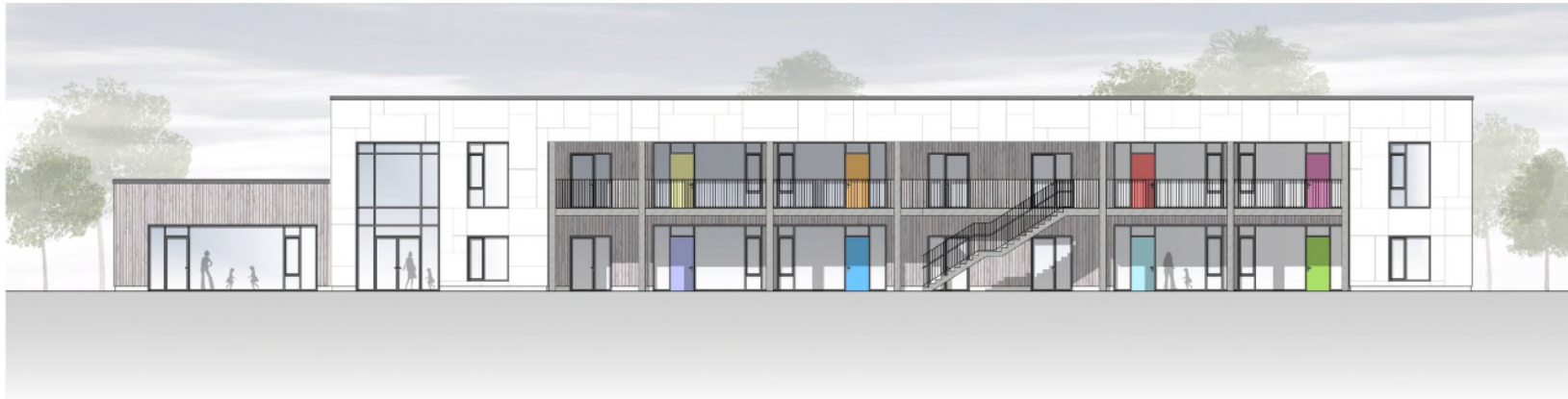
Neubau Kita Goldgrube