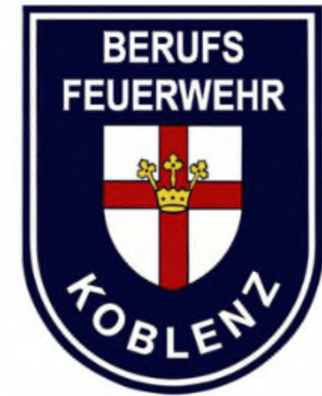
Erweiterung der Integrierten Leitstelle Koblenz