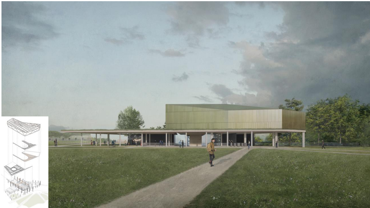
Abb. 4: Ansicht Bergstation mit Festungsmauer & Tragwerkskonzept 1