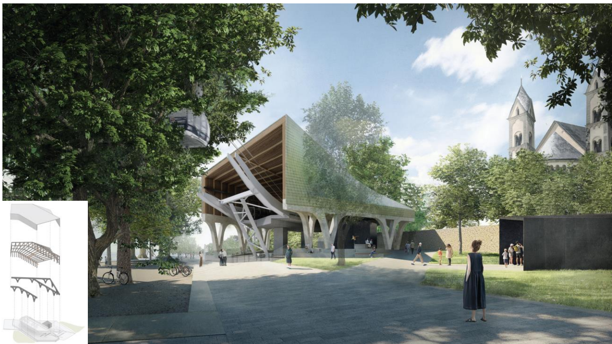
Abb. 3: Ansicht Talstation mit Basilika St. Kastor & Tragwerkskonzept 1

Sowohl die Tal- als auch die Bergstation sollen im neuen Design auf das "Welterbe Oberes Mittelrheintal" sowie auf die der Talstation benachbarten Kulturdenkmäler Basilika St. Kastor und Deutsches Eck reagieren. Der Siegerentwurf des Architekten Wettbewerbs orientiert sich hierfür hinsichtlich der Farb- und Materialwahl sowie der Formsprache der neuen Verkleidung der Stationen an der natürlichen sowie historischen Umgebung, während das technische Fundament der vorhandenen Stationen erhalten bleibt. Insgesamt werden mit dem neuen Entwurf planungsrechtlich ca. 130 m 2 zusätzlich der Talstation im Vergleich zur Änderung Nr. 2 und 3 des Bebauungsplanes Nr. 120 zugeordnet. Teil der Fläche ist das Stationsgebäude, Kassengebäude, Wegeflächen und Aufenthaltsflächen.