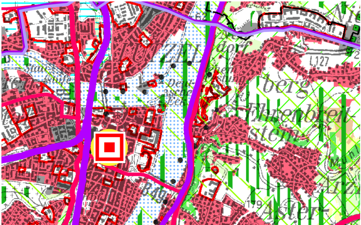
Abb. 2: Auszug Regionaler Raumordnungsplan Mittelrhein-Westerwald 2017