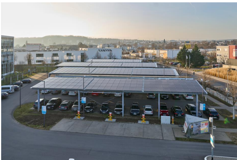
Abbildung 5: Solarpark auf dem Parkplatz am Moselbad (Stand März 2026)

Das Photovoltaikprojekt am Moselbad wurde im Dezember 2025 erfolgreich in Betrieb genommen. Insgesamt wurden 104 der 137 Stellplätze mit einer leichten Stahlkonstruktion überdacht und mit 896 Solarmodulen ausgestattet. Der erzeugte Strom wird vollständig für den Eigenbedarf des städtischen Hallenbads genutzt. Mit einer installierten PV-Fläche von rund 1.792 m 2 leistet die Anlage einen erheblichen Beitrag zur Reduktion von Treibhausgasemissionen: Jährlich können bis zu 173.200 kg CO 2 eingespart werden. Der prognostizierte solare Jahresertrag der Anlage beträgt insgesamt 368.569 kWh.