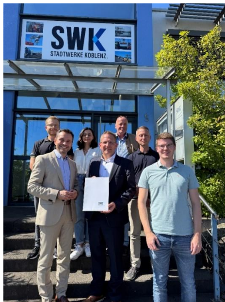
Abbildung 9: Einreichung Förderantrag

Das Gebiet Wallersheim/Kesselheim ist rund um das Industriegebiet im Rahmen der kommunalen Wärmeplanung als Prüfgebiet ausgewiesen worden. Zum Zeitpunkt der Erstellung der kommunalen Wärmeplanung lagen zu wenige Informationen seitens der vor Ort ansässigen Unternehmen vor, sodass sich weder eine Einteilung als Wasserstoffnetzgebiet noch als Wärmenetzgebiet eindeutig ergeben hat. Um in diesem Gebiet den dort ansässigen Unternehmen eine Orientierung zu geben, wurde der Förderantrag zur Erstellung einer Machbarkeitsstudie von den Stadtwerken im Konsortium mit sechs interessierten Unternehmen im August 2025 gestellt. Am 5. März 2026 haben die Stadtwerke einen positiven Bewilligungsbescheid erhalten. Der Bewilligungsbescheid ist bis zum 31.12.2026 ausgesprochen. Im Rahmen einer durchgeführten Ausschreibung wurde der Dienstleister für die Erstellung der Machbarkeitsstudie (IFAS) beauftragt. Ziel ist der Machbarkeitsstudie ist, Klarheit darüber zu bekommen, ob das Gebiet zukünftig mit Wärme oder Wasserstoff versorgt werden soll. Der Kernhaushalt wird hiervon nicht beansprucht. Die Finanzierung erfolgt über die Projektpartner sowie die Förderung.