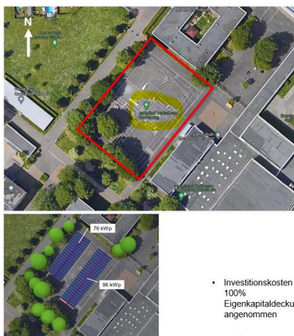
Variante 3 - Ausgleichsfläche Verkehrsübungsplatz

Der Antrag AT/0065/2023 „Mit versiegelten Parkflächen erneuerbare Energien erzeugen“ wurde über das Zentrale Gebäudemanagement (ZGM) weiterverfolgt. Die Fläche wird derzeit ausschließlich als Verkehrsübungsplatz genutzt. Die Neuberechnung durch das ZGM hat ergeben, dass auch diese Maßnahme unwirtschaftlich ist.