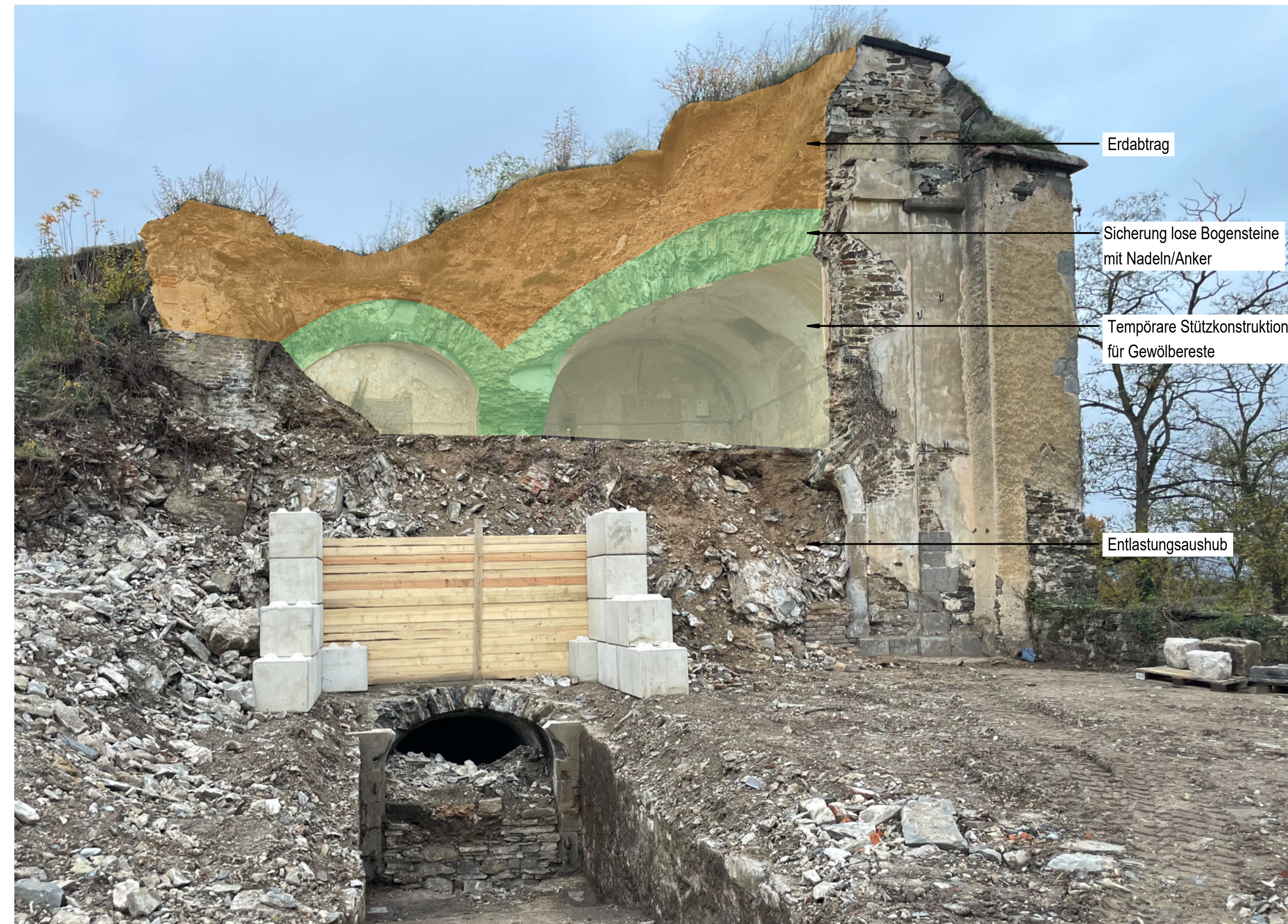
ANSICHT NORD [o. M.] BESTANDSFOTO MIT EINTRAGUNGEN