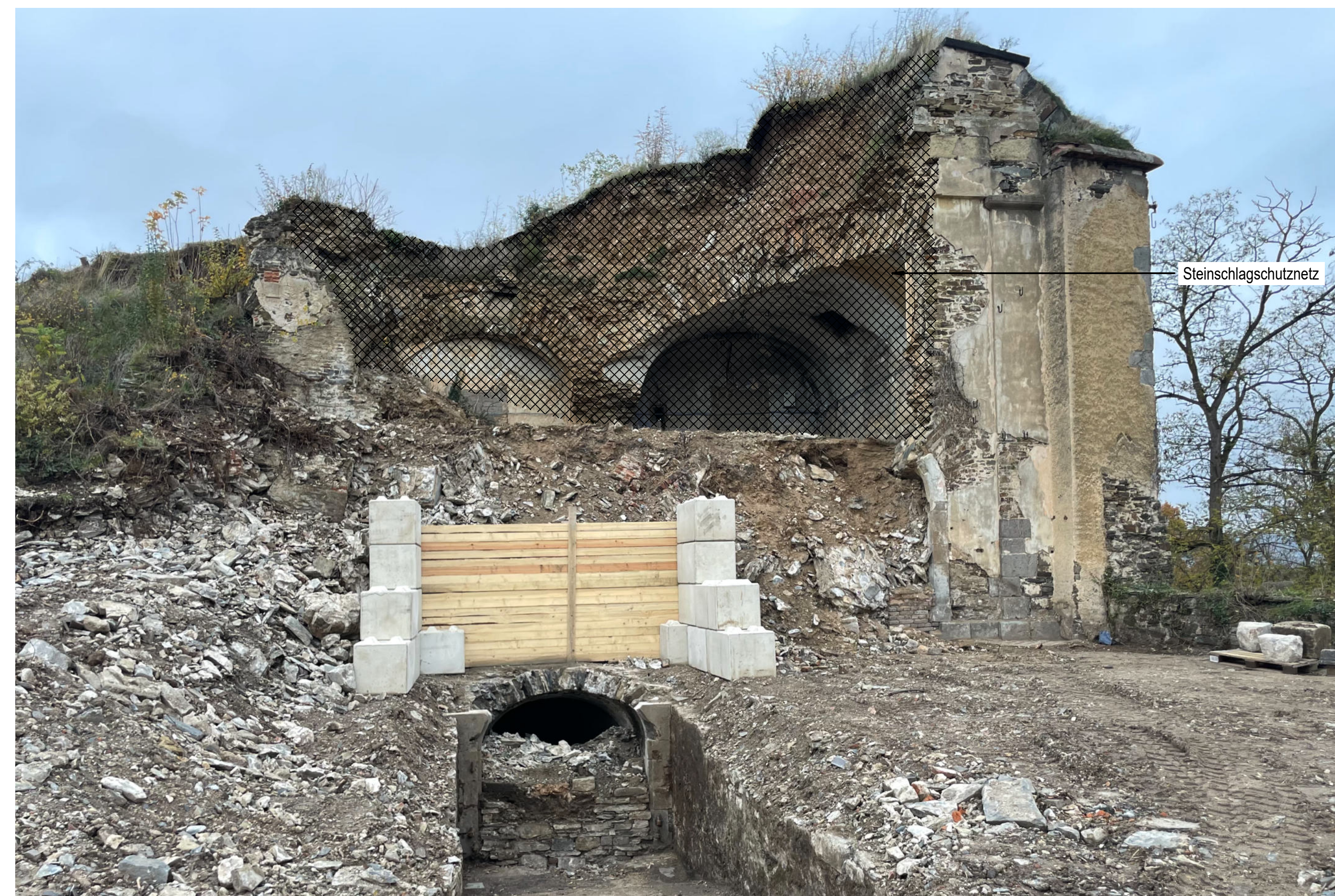
ANSICHT NORD [o. M.] BESTANDSFOTO MIT EINTRAGUNGEN