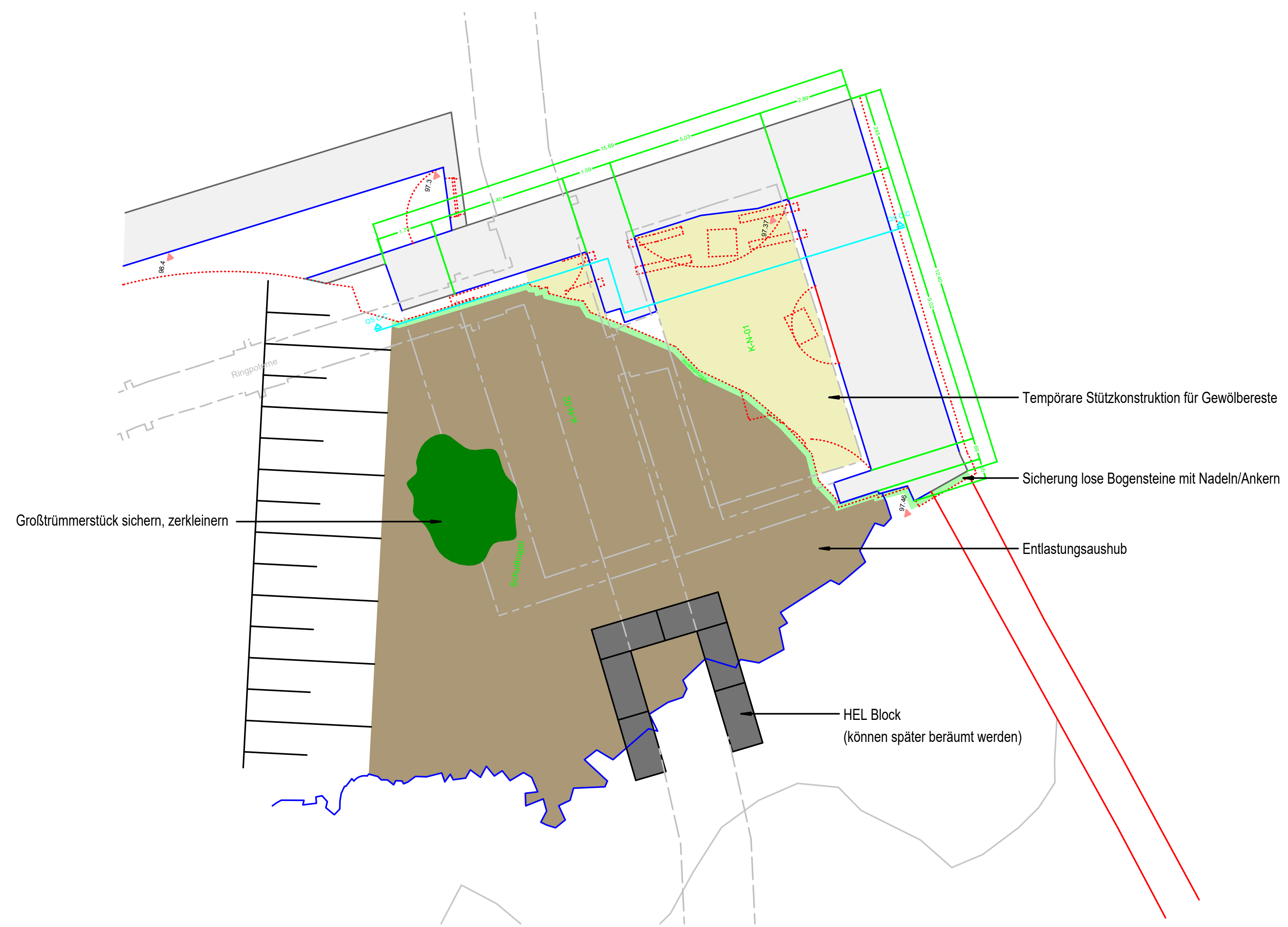
GRUNDRISS [M 1:100] NÖRDLICHER KOPFBAU | BESTAND