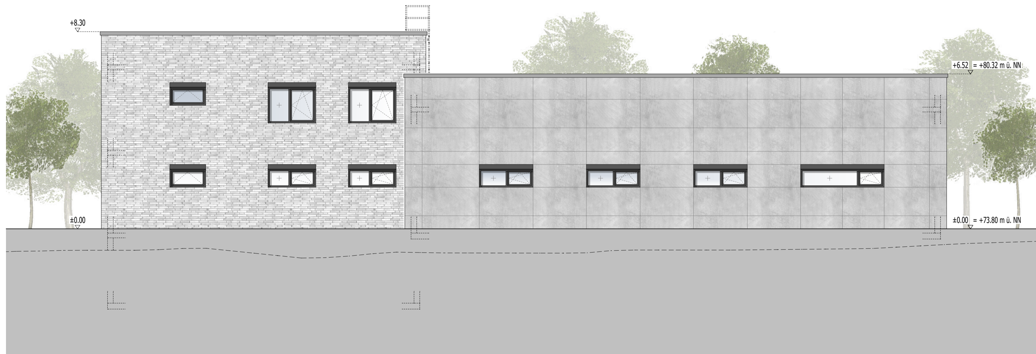
Ansicht West | 1:100