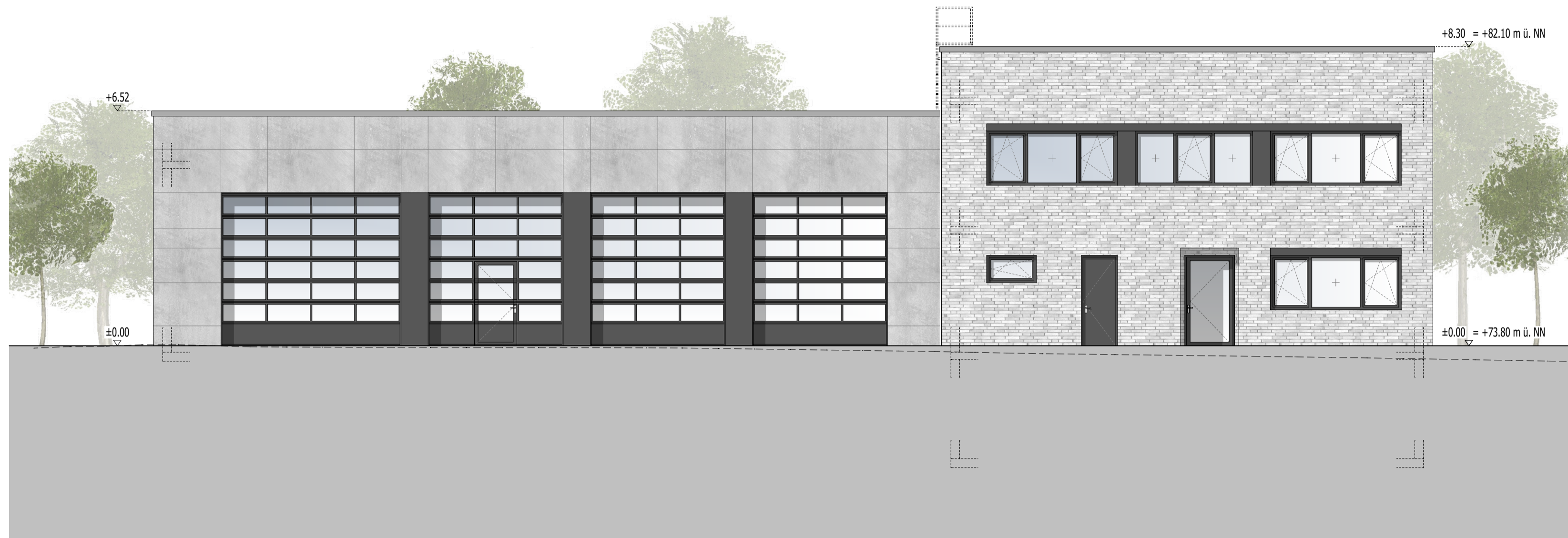
Ansicht Ost | 1:100