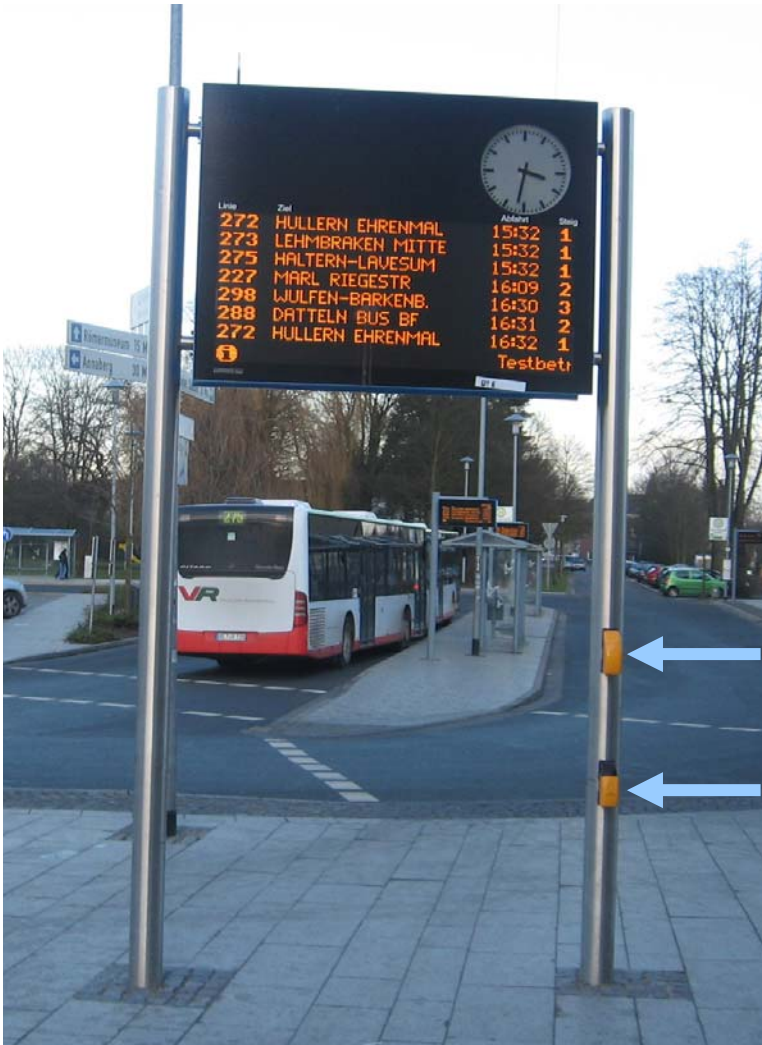
ZOB Haltern am See